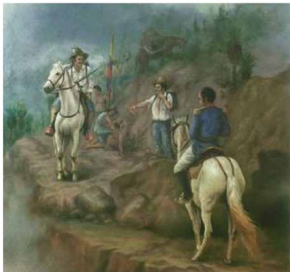
Bolívar atravesando el Páramo de Pisba. Carlos Mauricio Ogliastrí. (2018). Recuperado: http://www.oscarhumbertogomez.com/?p=22765

El proyecto Ruta del Bicentenario en el año preparatorio para la conmemoración de la Independencia de nuestro país busca socializar el proceso histórico de la Campaña Libertadora promoviendo la participación de la ciudadanía dentro de un espíritu de inclusión y democracia. De esta manera se viene trabajando en tres categorías principales: Gentes, Pueblos y Batallas, reconociendo a través de estos acontecimientos, rutas de los ejércitos, fechas, condiciones geo-climáticas, personajes, colectivos y lugares simbólicos.