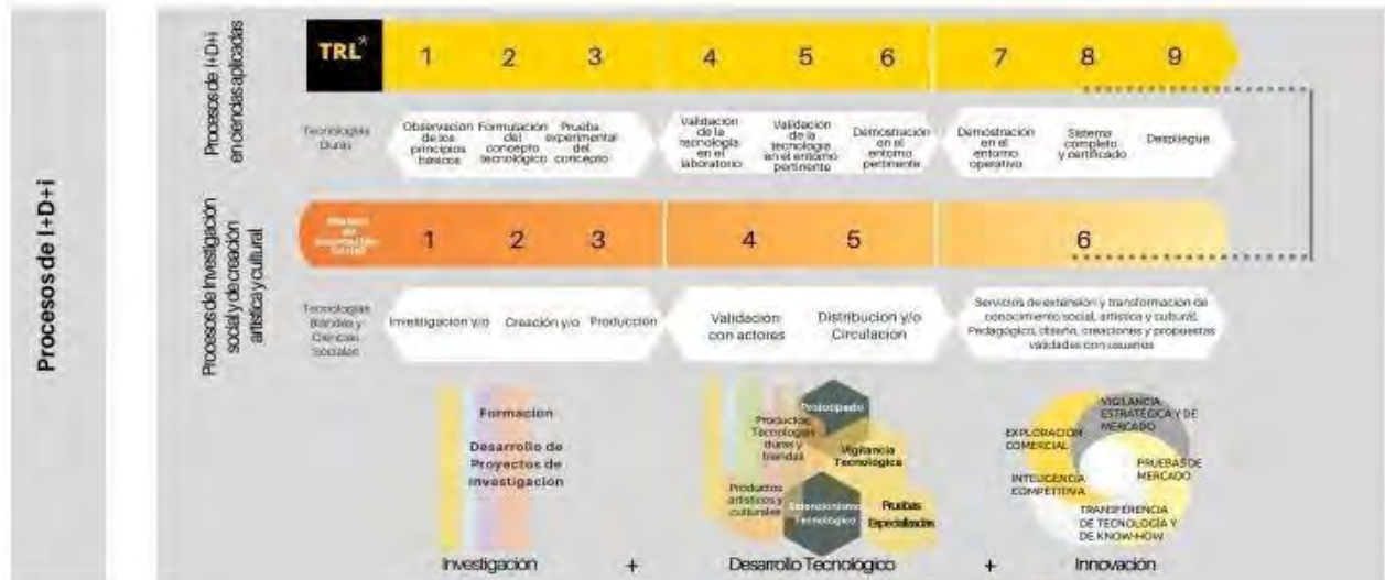
Figura 4 Procesos de I+D+i+CE

Estos dos campos se identifican en el Sistema dentro de los procesos de I+ D+i, de la siguiente forma: