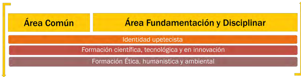
Ilustración 2: Áreas y ejes de formación

En atención a su autonomía, la universidad asume el área de formación como el espacio curricular que garantiza la organización y el desarrollo de conocimientos a partir de los propósitos de formación institucionales y de cada programa y en consonancia con las diferentes disposiciones que regulan la educación superior.