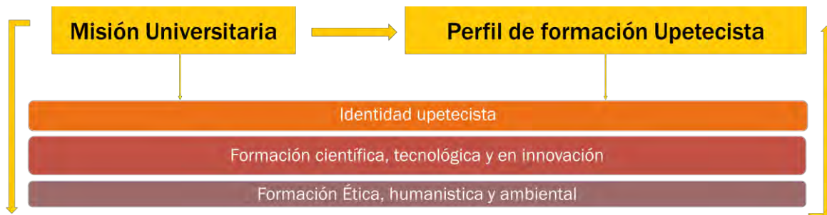
Ilustración 1: Ejes de formación

Los ejes de formación del plan sostienen el proyecto curricular upetecista, son transversales al mismo dan sentido, y orientación. Así: