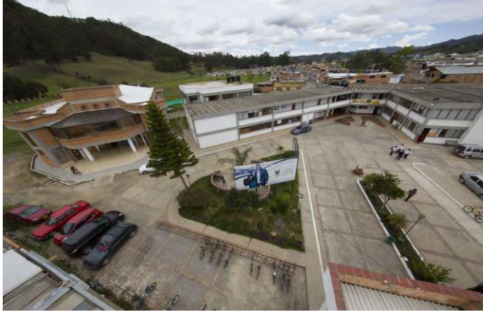
EDIFICIO REINALDO PEDRAZA