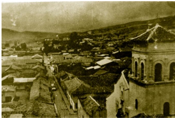
Foto Tunja colonial