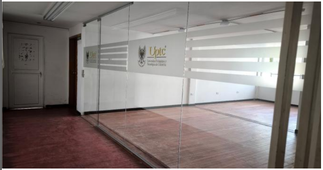
FOTO 4: Suministro e instalación de división en vidrio templado piso techo herrajes en acero.

Anexos: Listas de chequeo de visitas de obra: