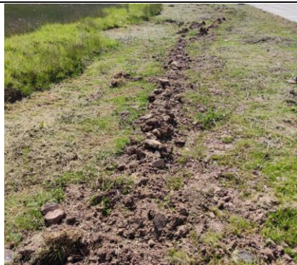
FOTO 1: Trazado de la red instalada y cubierta con material seleccionado