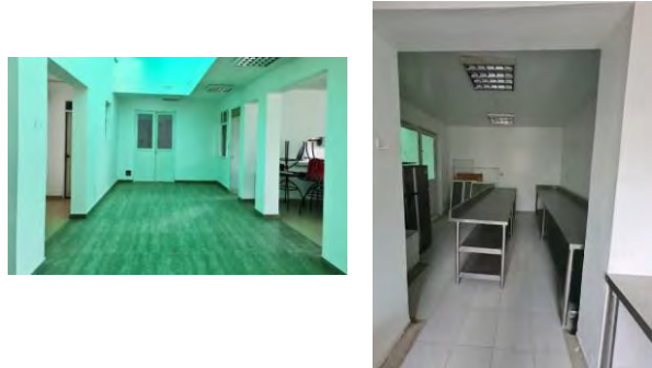
FOTO 6: VINILO TIPO I Y PINTURA EPOXICA EN MUROS RESTAURANTE DE PROFESORES

Anexos: Listas de chequeo de visitas de obra. (Nº. De listas de chequeo)