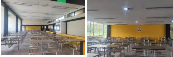
FOTO 1: VINILO TIPO I EN MUROS, PINTURA BAJO PLACA E INSTALACIÓN DE LUMINARIAS RESTAURANTE ESTUDIANTIL