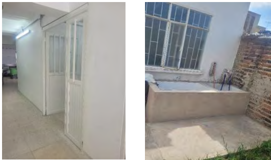
FOTO 5: PUERTA EN CUARTO FRIO Y CONSTRUCCION DE POCETA PARA LAVADO DE ELEMENTOS DE ASEO-RESTAURANTE ESTUDIANTIL