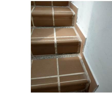
FOTO 5: Guardacascos en tablón de gres color sahara ( ESCALERA DE ACCESO A OFICINAS Y DECANATURA DE DERECHO)