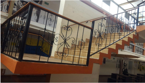
FOTO 1: Pasos en escalgres salmón 0,20x0,17 tipo alfa. (ESCALERA PARTE CENTRAL DERECHO)