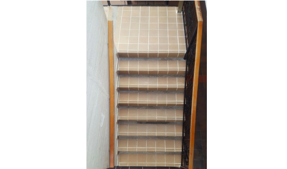
FOTO 4: Suministro e instalación de gravilla lavada y emboquillado.