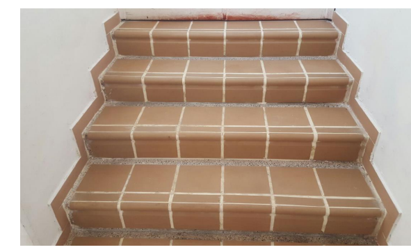
FOTO 6: Pasos en escalgres salmón 0,20 m X 0,17 m tipo alfa (ESCALERA DE ACCESO A OFICINAS Y DECANATURA DE DERECHO)

Anexos: Listas de chequeo de visitas de obra. (N°. De listas de chequeo)