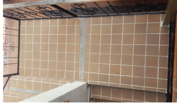
FOTO 2: Pasos en escalgres salmón 0,20x0,17 tipo alfa, gravilla No.2 lavada y tablón de gres latino sahara 0,20x0,20. (ESCALERA DE ACCESO A OFICINAS Y DECANATURA DE DERECHO)