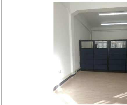
FOTO 1: Aplicación de pintura vinilo tipo II sobre pañete dos manos en muros internos.