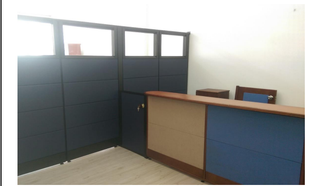
FOTO 4: División en lámina CR esp 8 cms. (0,60m altura) puerta de acceso a recepción.