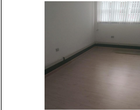
FOTO 3: Suministro e instalación de piso laminado tráfico pesado antideslizante, tipo pesado de 8,3 mm.