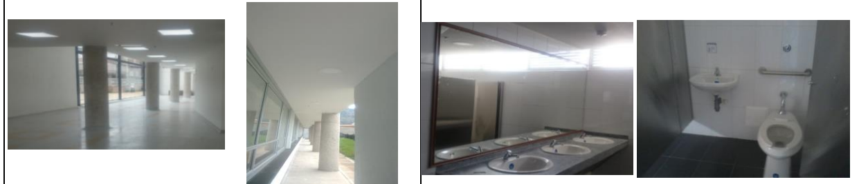
FOTO 5: Instalación Luminarias en pasillos y Exteriores de la Edificación