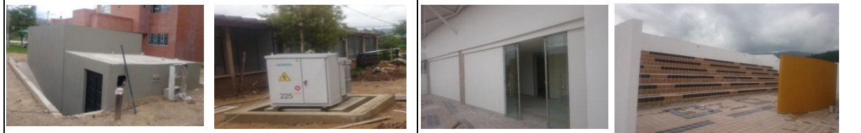
FOTO 3: Acabado general Tanque de almacenamiento y Transformador de Distribución