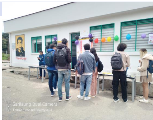
Conmemoración visibilidad lésbica