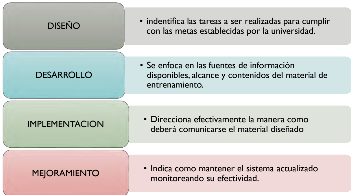
Figura 1. Fases plan de sensibilización, capacitación y comunicación