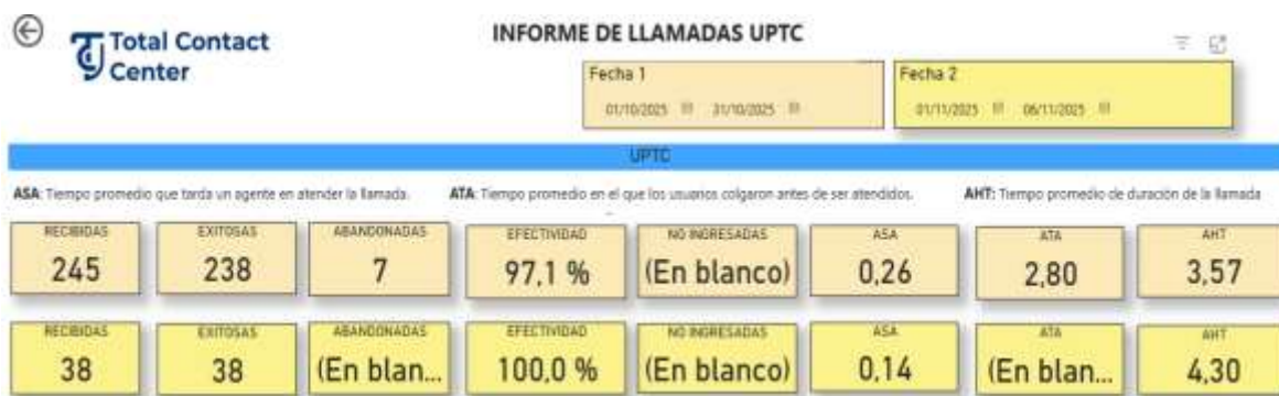
Figura 1. Reporte consolidado de llamadas atendidas por el Call Center Unisalud-UPTC.

Estos indicadores permiten concluir que durante el mes de septiembre el Call Center mantuvo una buena capacidad de respuesta y eficiencia operativa, garantizando la continuidad del servicio y la atención oportuna de las solicitudes. La baja proporción de llamadas abandonadas y los tiempos promedio de respuesta inferiores a un minuto indican un adecuado dimensionamiento de personal y una correcta gestión de picos de demanda.