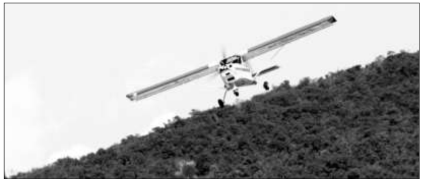
El cielo de Paipa también fue escenario de las llamadas aeronaves ultralivianas, durante la celebración del primer Festival del Lago.

El Lago de Sochagota es la base de gran parte de la industria turística de la ciudad de Paipa, así que su conservación y equilibrio ecológico serán la única garantía para que tal fortaleza se mantenga.