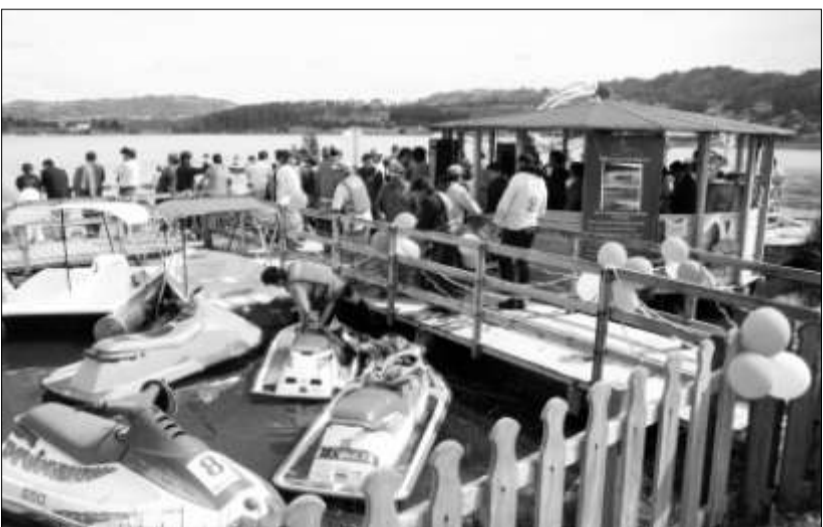
El muelle del Hotel Panorama de Comfaboy servirá para que muchas personas se familiaricen y practiquen los deportes náuticos.