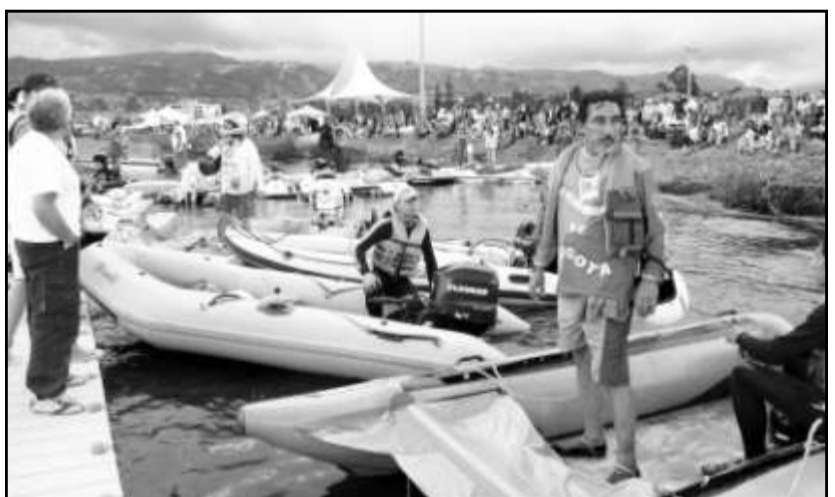
Las competencias náuticas fueron la principal atracción durante el Festival, las cuales fueron observadas aprovechando el magnífico espacio del Malecón.