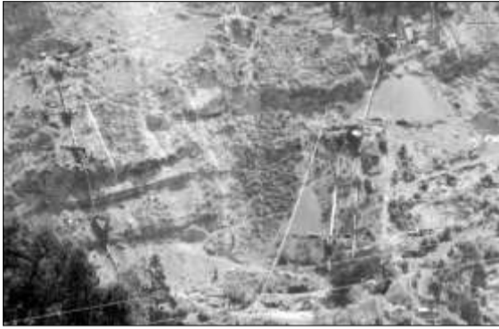
Socavones en plena ladera de las montañas del municipio. El deterioro del entorno es evidente

negocio y que eso no lo aceptan; y, por otra parte, con el argumento más contundente: la experiencia de varias décadas de explotación indiscriminada y antitécnica del mineral, ha disminuido o desaparecido el agua, y lo que queda de este recurso está contaminado.