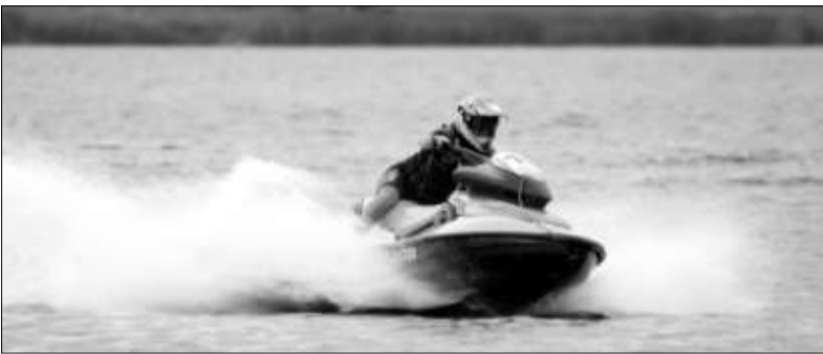
El espectáculo náutico que combina la potencia de la máquina, la habilidad del piloto y la belleza del Lago.