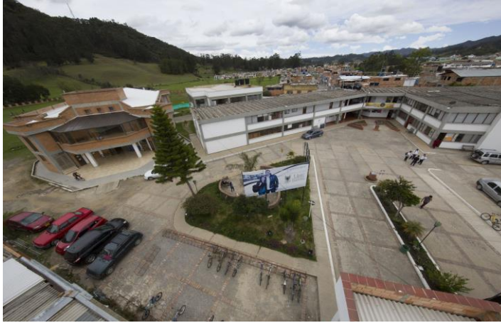
EDIFICIO REINALDO PEDRAZA