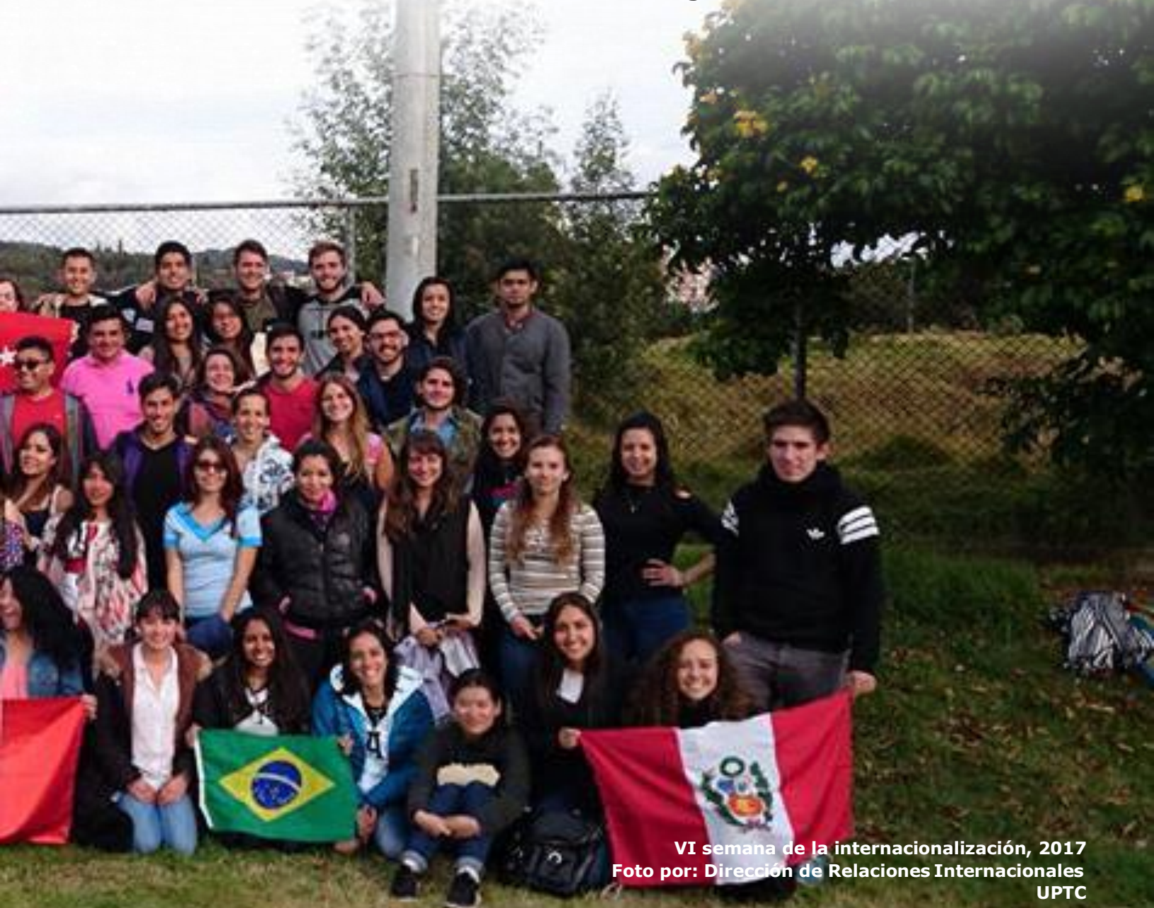
VI semana de la internacionalización, 2017

En cuanto a la movilidad entrante para el periodo 2014 – 2018 la Universidad ha recibido 269 estudiantes de diferentes países como: Alemania, Argentina, Bélgica, Brasil, Chile, China, Corea Del Sur, Ecuador, España, Estados Unidos, Francia, Granada, India, Inglaterra, Jamaica, México, Panamá, Paraguay, Perú, Reino Unido, Rusia, Turquía y Venezuela. Además de regiones nacionales como Casanare, Huila, Tolima, Bogotá, Sucre, entre otras.