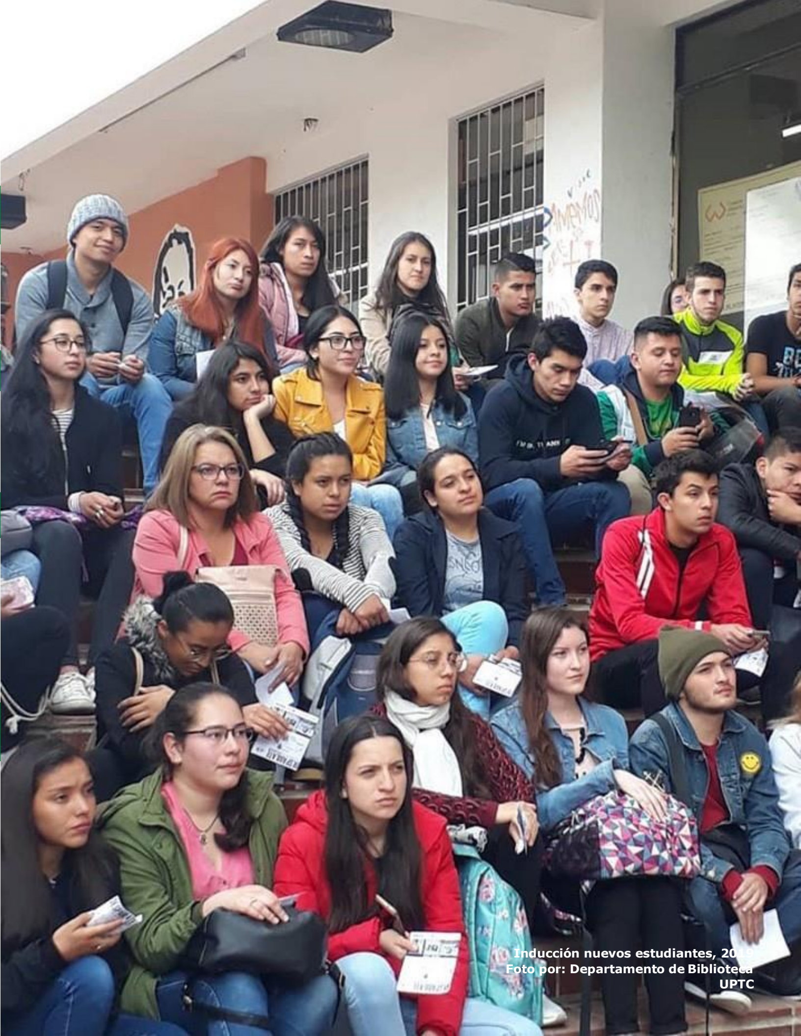
Inducción nuevos estudiantes, 2019