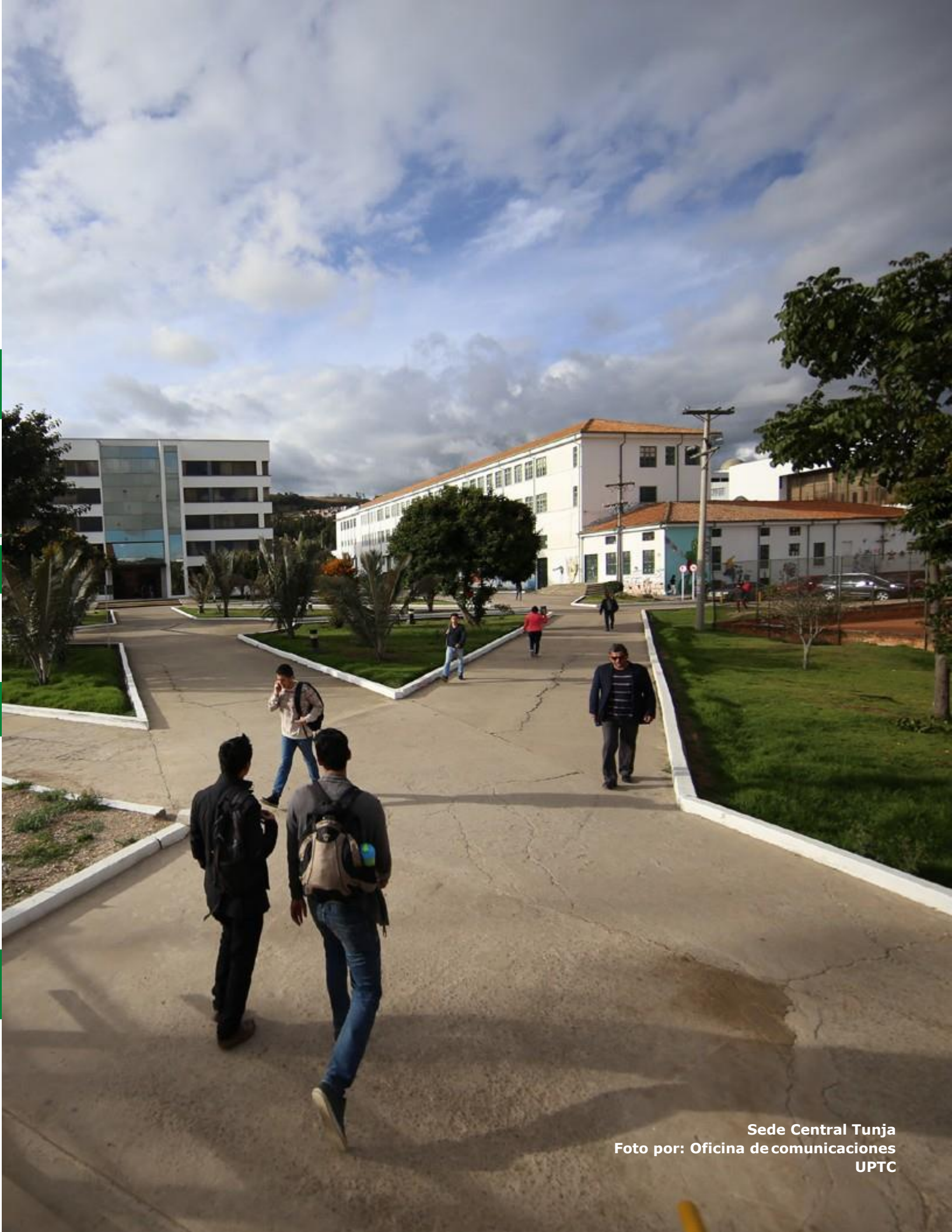
Sede Central Tunja