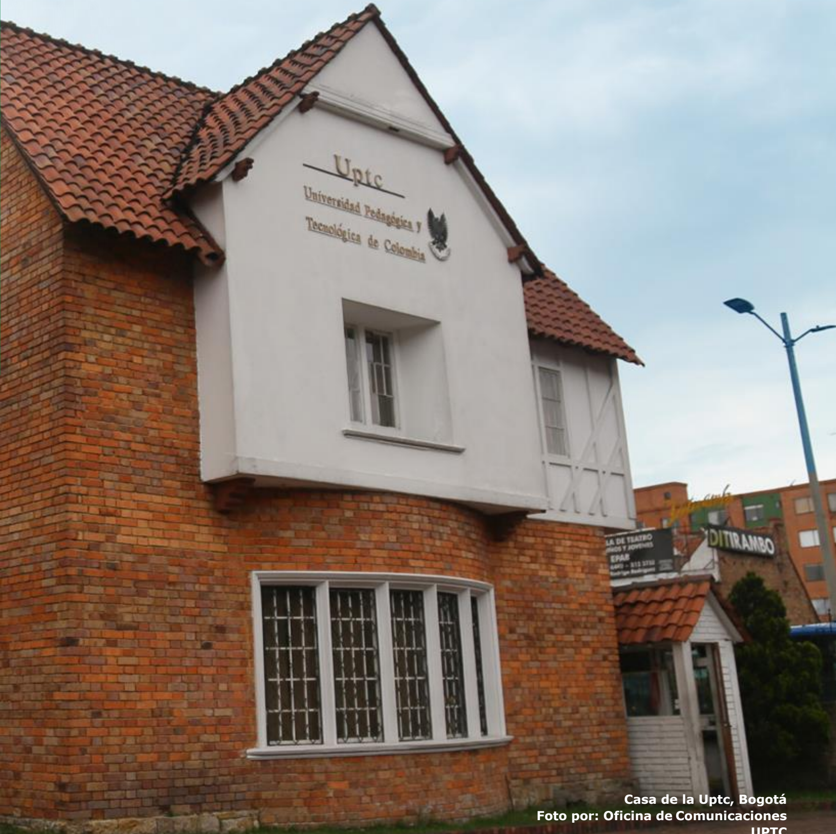
Casa de la Uptc, Bogotá