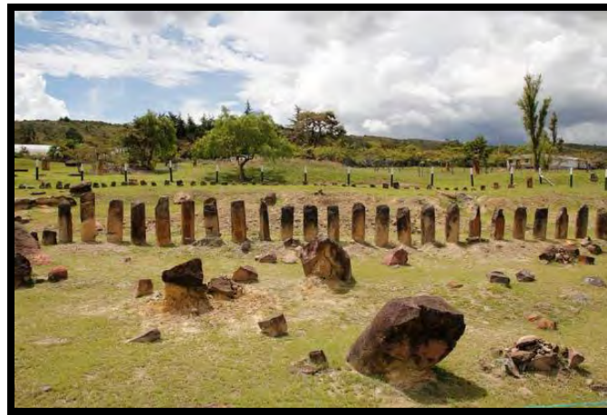
Ilustración 12 Museo Arqueológico Villa de Leyva