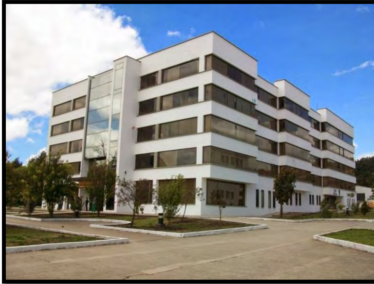
Ilustración 2 Edificio Administrativo

El edificio Administrativo se ubica en la Universidad Pedagógica y Tecnológica de Colombia, Sede Central en las coordenadas 5°33'04" N ; 73°21'27" W , a una altura media sobre el nivel del mar de 2693m. Este edificio es conocido como el principal centro de operaciones de carácter administrativas de toda la universidad.