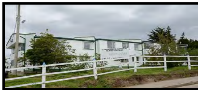
Ilustración 5 Bioplasma