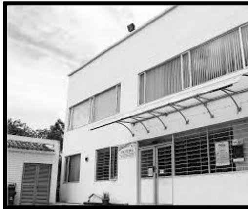
Ilustración 4 INCITEMA