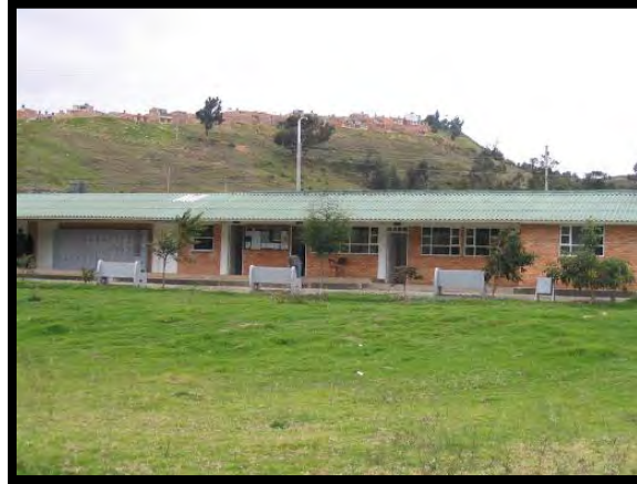
Ilustración 7 Clínica Veterinaria