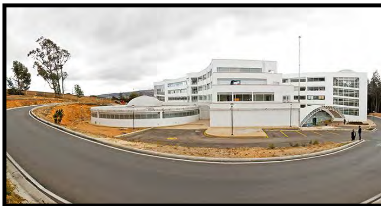
Ilustración 3 Centro de Laboratorios