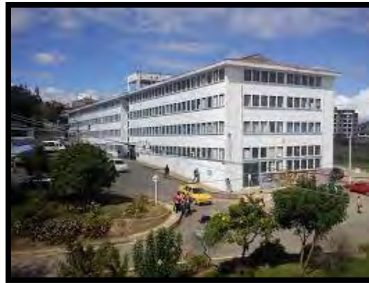
Ilustración 6 Laboratorios Antiguos