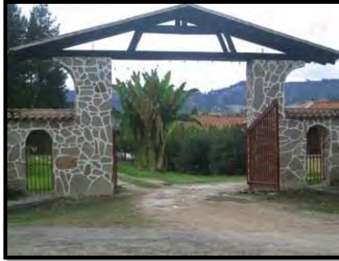
Ilustración 10 Granja Tunguavita