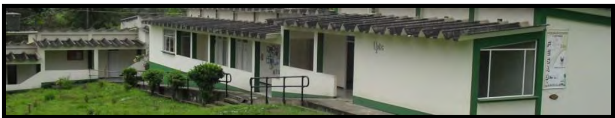
Ilustración 9 CREAD Garagoa