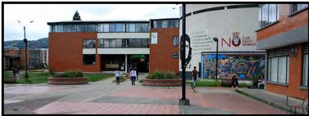
Ilustración 8 Administrativo y Biblioteca Sogamoso