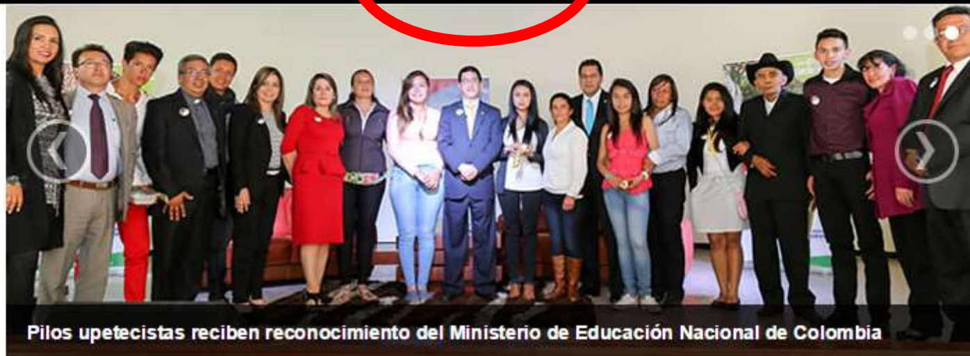
Pilos upetecistas reciben reconocimiento del Ministerio de Educación Nacional de Colombia