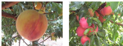
Imagen 1-2: Durazno Rubidoux y Ciruela Horvin

Durazno ( Prunus pérsica.L ) y Ciruelo ( Prunus domestica.L )