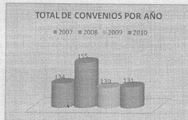
CONVENIOS NACIONALES VIGENTES Y EJECUTADOS