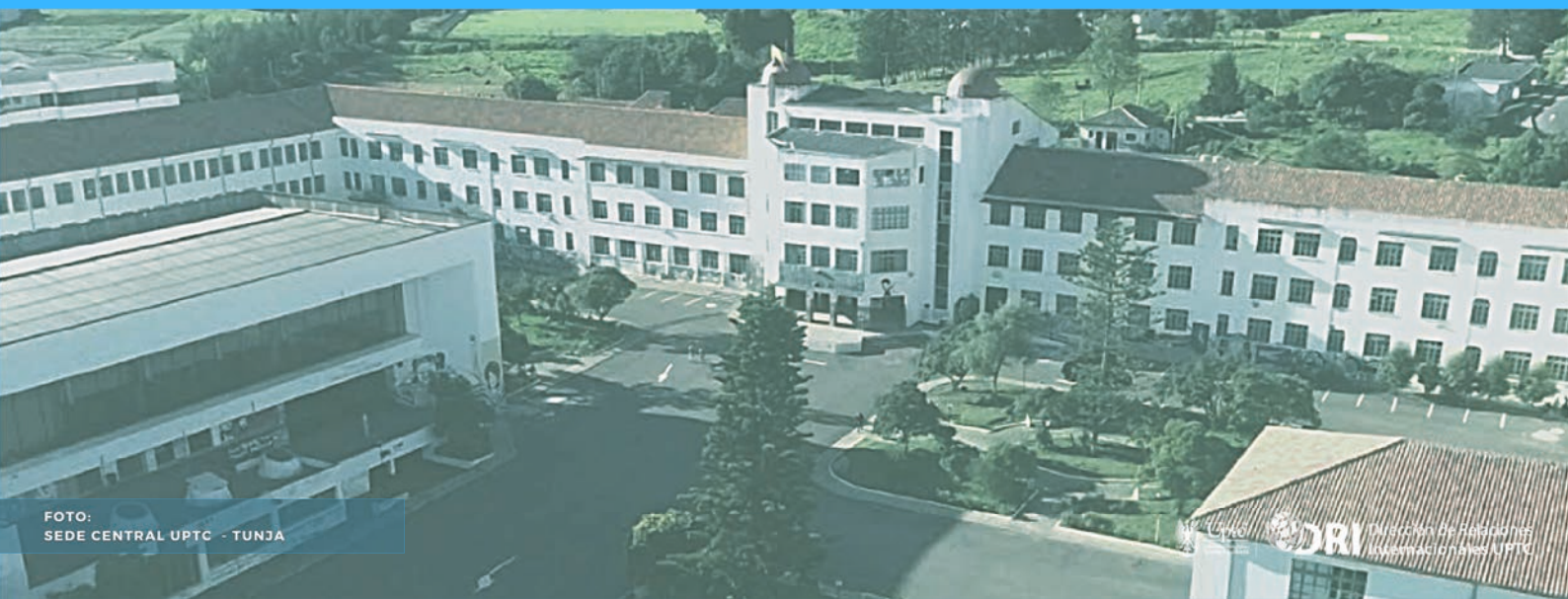
FOTO: SEDE CENTRAL UPTC - TUNJA