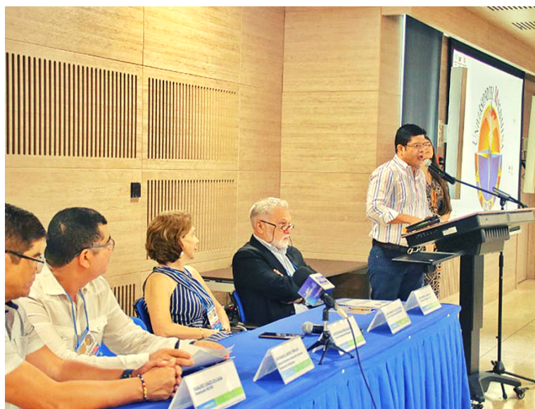
Inauguración del Coloquio...