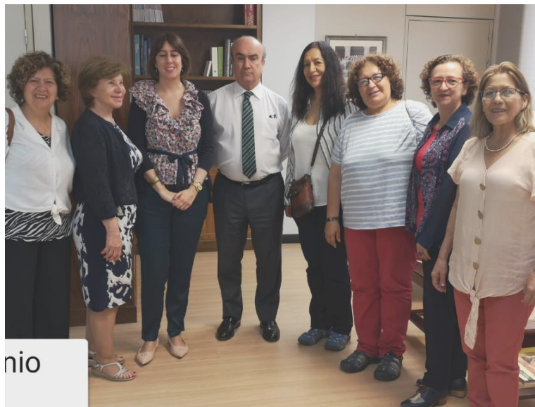
Reunión Docentes UPTC, junto a Secretario General de la OEI, 21 de junio de 2019.