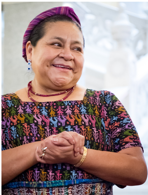
Rigoberta Menchú Tum, Premio Nobel de Paz -1992.

En el marco del Congreso Internacional Bicentenario de la Independencia de Colombia (1819-2019), Mesa de trabajo: Educación rural indígena en América Latina que coordina el Doctorado en Ciencias de la Educación UPTC- RUDECOLOMBIA, confirmamos que una vez adelantadas las gestiones oportunas y con el apoyo de la Gobernación de Boyacá, contaremos con la participación de Rigoberta Menchú Tum, Premio Nobel de la Paz, líder social, activista, dirigente política, escritora y guía espiritual, que ha trabajado incansablemente en la defensa y reivindicación de los derechos de las mujeres y de los pueblos indígenas, el día 5 de agosto. Así mismo, la Dra. Menchú inaugurará la XIV Jornada Académica del doctorado en Ciencias de la Educación, el día 6 de agosto de 2019, a las 10:00 am en el Auditorio 1, Edificio de Aulas Hunza de la UPTC.