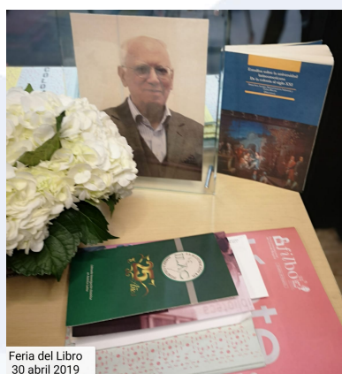
Feria del Libro 30 abril 2019