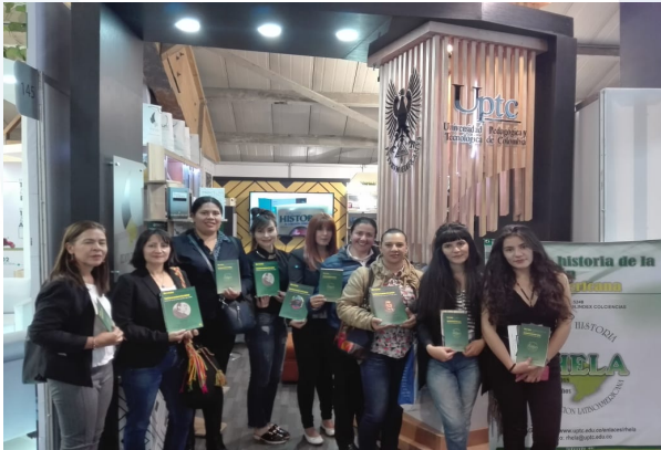
Presentación la RHELHA en la FILBO, 2019.