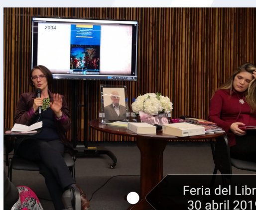
Feria del Libro 30 abril 2019