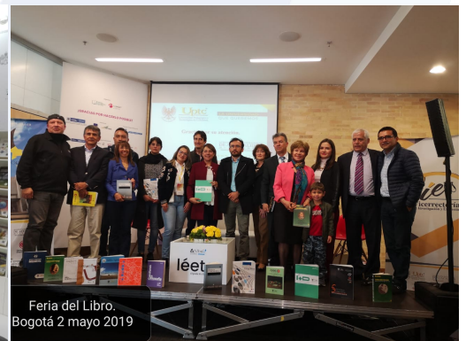
Presentación de Revistas UPTC en la FILBO, 2019.