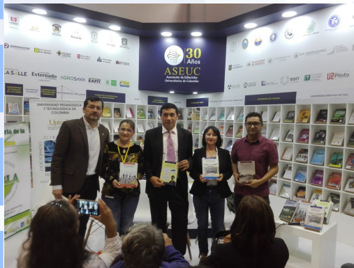
Presentación Colección Tesis Doctorales Cum Laude en la FILBO, 2019.