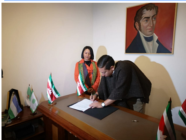
Posesión Directora técnica pedagógica del Dpto. Boyacá.