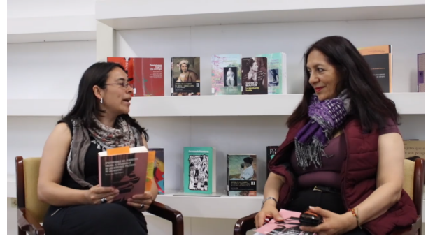
Presentación de libros - Programa Exlibris.Uptc.