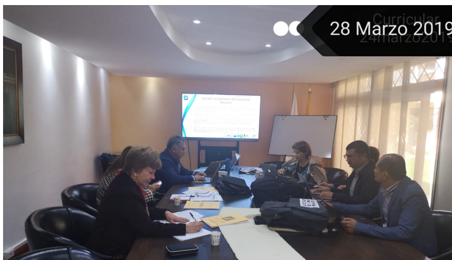
Comité Curricular, Doctorado en Ciencias de la Educación RUDECOLOMBIA. Dirección de Postgrados UDEC.

Los días 28 y 29 de marzo de 2019, sesiona el Comité Curricular Nacional del doctorado en Ciencias de la Educación de RUDECOLOMBIA en la sede de la Asociación Colombiana de Universidades -ASCUN.