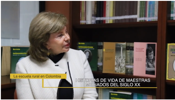
Presentación de libros - Programa Exlibris.Uptc.