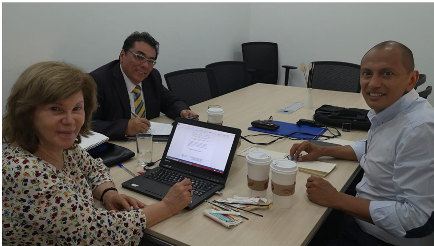
Asesoría Doctorado en Ciencias de la Educación RUDECOLOMBIA. Dirección de Postgrados UDEC.