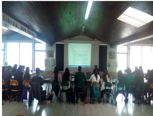
Taller sobre Educación Rural- ENS, Villapinzón.

Dentro de la política de extensión del CADE-UPTC, se desarrolló el Taller: educación rural en Colombia, dirigido a estudiantes de la Escuela Normal Superior de Villapinzón, los días 11 y 12 de marzo de 2019. Se abordó el concepto de ruralidad, como categoría de análisis para orientar la investigación educativa, resignificar la práctica pedagógica y fortalecer los procesos de enseñanza aprendizaje en las ENS.