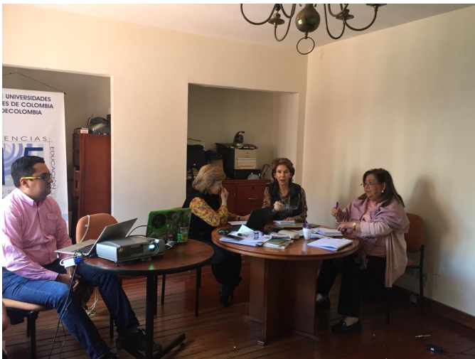
Comisión Internacionalización Doctorado en Ciencias de la Educación RUDECOLOMBIA.