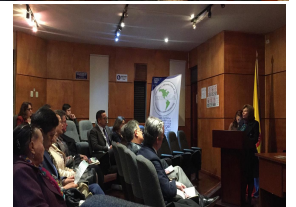
Galería fotográfica XII Jornada académica del Doctorado en Ciencias de la Educación UPTC-RUDECOLOMBIA.