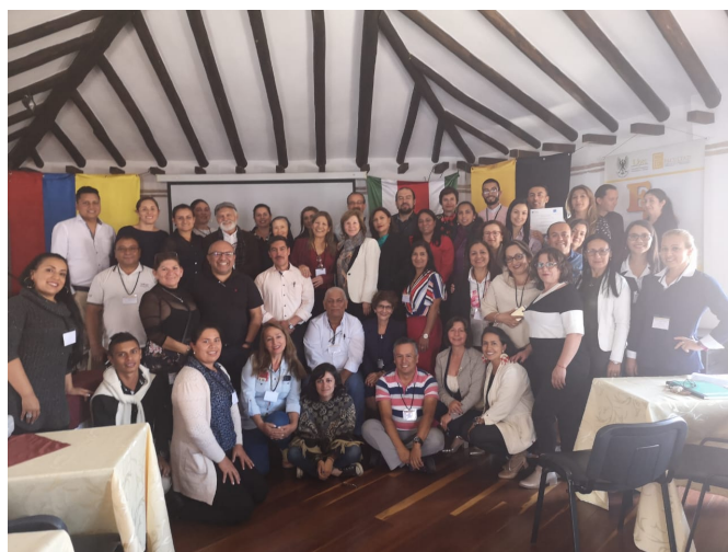
Participantes en el Encuentro de las ENS-UPTC.

Doctorado.educacion@uptc.edu.co Avenida central del Norte 39-115 Edificio Administrativo. 2do. Piso Tel: 0387448215- 0387405626 Ext. 2465