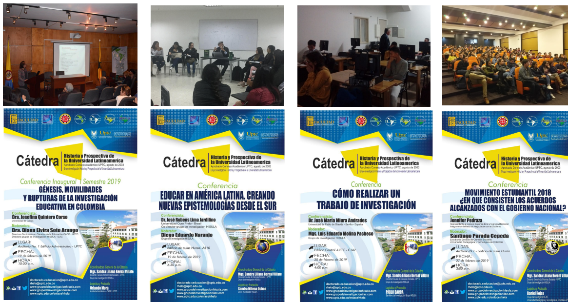
Galería fotográfica. Sesiones de la Cátedra HISULA, febrero/2019