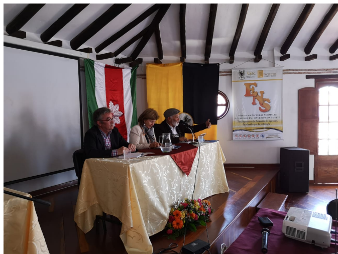
Investigadores internacionales del Grupo HISULA y Directora del CADE en encuentro de las ENS-UPTC.