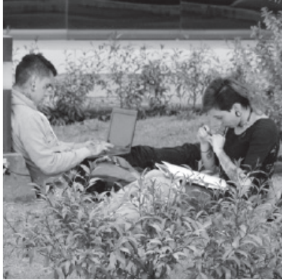
Fotografía: Julián Mauricio Camargo Sede Central UPTC - Tunja.

El ejercicio de la docencia ha cambiado en las últimas décadas. El enfoque paradigmático que se da al mismo no se fundamenta únicamente en la transmisión y/o construcción de conocimientos, sino en una atención completa, orientada a la formación integral de los estudiantes.