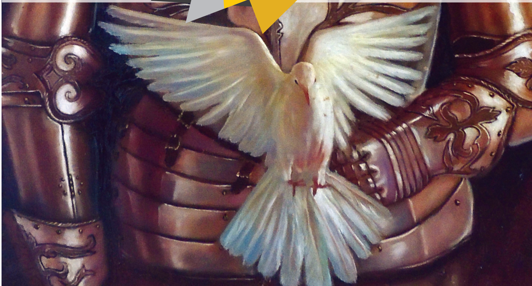
Título de la obra: LA ARMADURA DEL ESPÍRITU Autor: Óscar Quintero