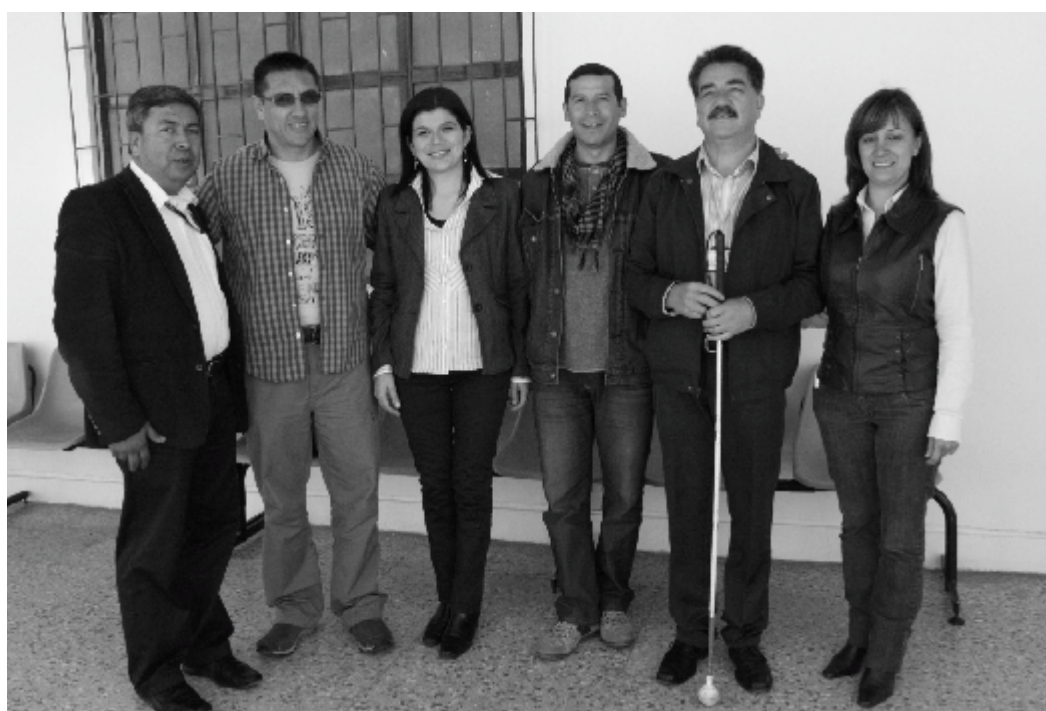
Grupo Interinstitucional Uptc Cotecol

Los servicios serán suministrados a los estudiantes durante los calendarios académicos definidos por la Universidad, a través de los consultorios de medicina y Psicología.