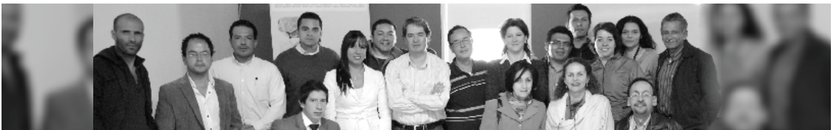
Integrantes CTR Centro Zoom Canal Universitario

La Universidad Pedagógica y Tecnológica de Colombia, UPTC, fue escogida en reunión realizada en la sede de la UDCA Bogotá, por representantes de varias Universidades de la región Centro, para ser la coordinadora del Comité Técnico Regional Centro de Zoom Canal Universitario, durante el período de un año.