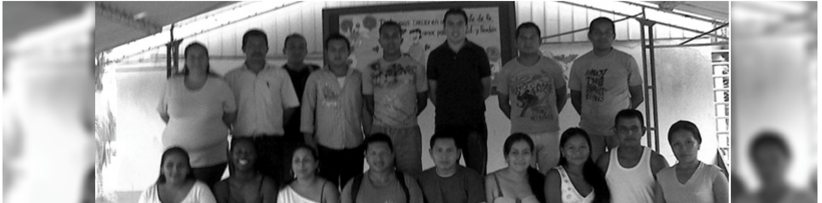
Estudiantes del CREAD de Barrancominas, Guainía, miembros de las comunidades indígenas Piapoco y Siquani.