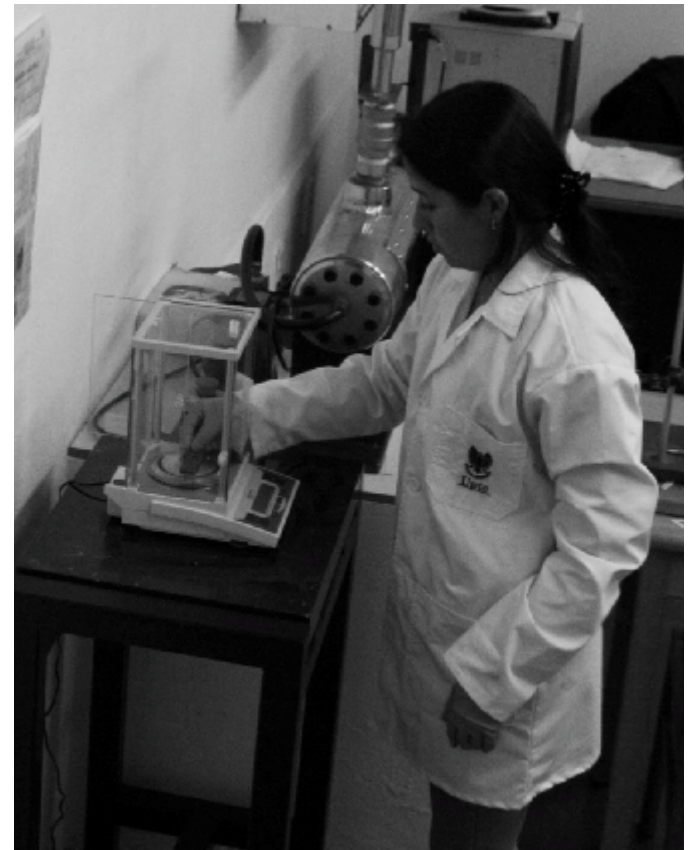
Laboratorio de corrosión e integridad

Una de las prioridades del rector de la UPTC, Gustavo Orlando Álvarez Álvarez, es tener la mayor parte de los Laboratorios de la Universidad acreditados y así poder brindar a la sociedad, equipos e infraestructura de soporte.