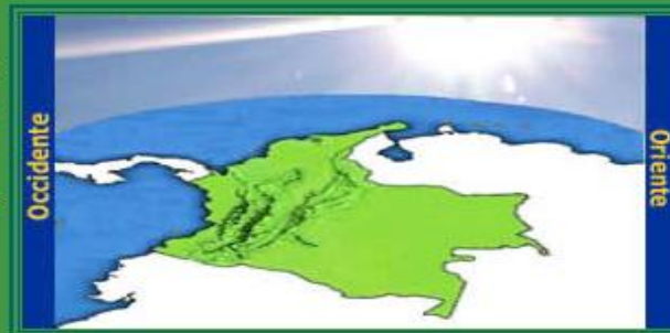
Posición actual aproximada del Sol respecto a Colombia

De acuerdo con lo establecido en el numeral 14 del artículo 6 del Decreto número 4175 de 2011, el Instituto Nacional de Metrología mantiene, coordina y difunde la hora legal de la República de Colombia.