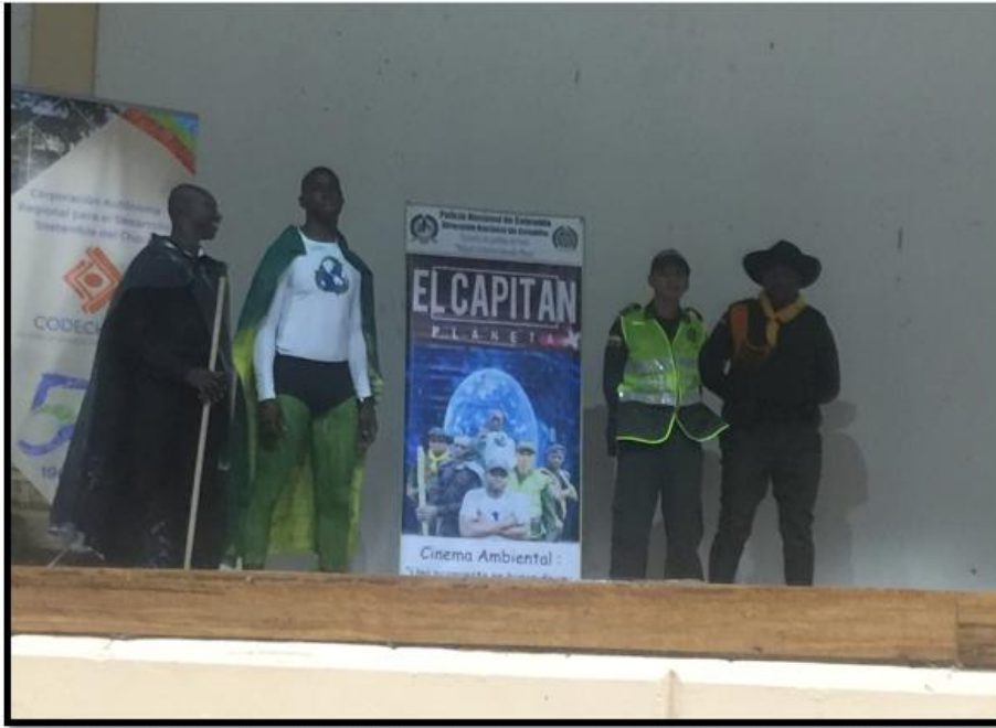
Imagen 4. Presentación cortometraje "Capitán Planeta", por estudiantes de la Escuela de Policía de Yuto.